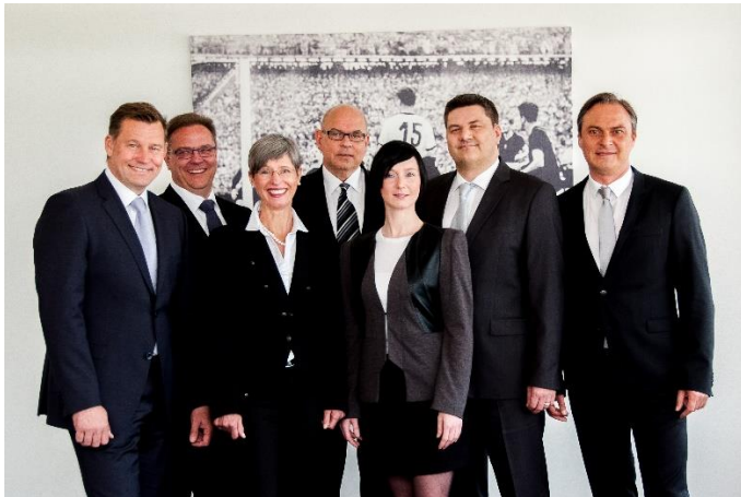
Bildunterschrift: Das Team der Franz Martz & Söhne Private Treuhand GmbH.